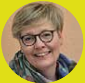
Regine Maeting Jugendwerk Kirche Ostholstein